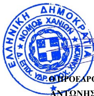
Ο ΠΡΟΕΔΡΟΣ Δ.Σ. ΔΕΥΑΧ ΑΝΤΩΝΗΣ ΣΧΕΤΑΚΗΣ

Με την υπ' αριθμό 108/26-03-2017 απόφαση Δ.Σ. ΔΕΥΑΧ (ΑΔΑ: ΩΦΧΕΟΕΨΡ=ΜΚΦ)